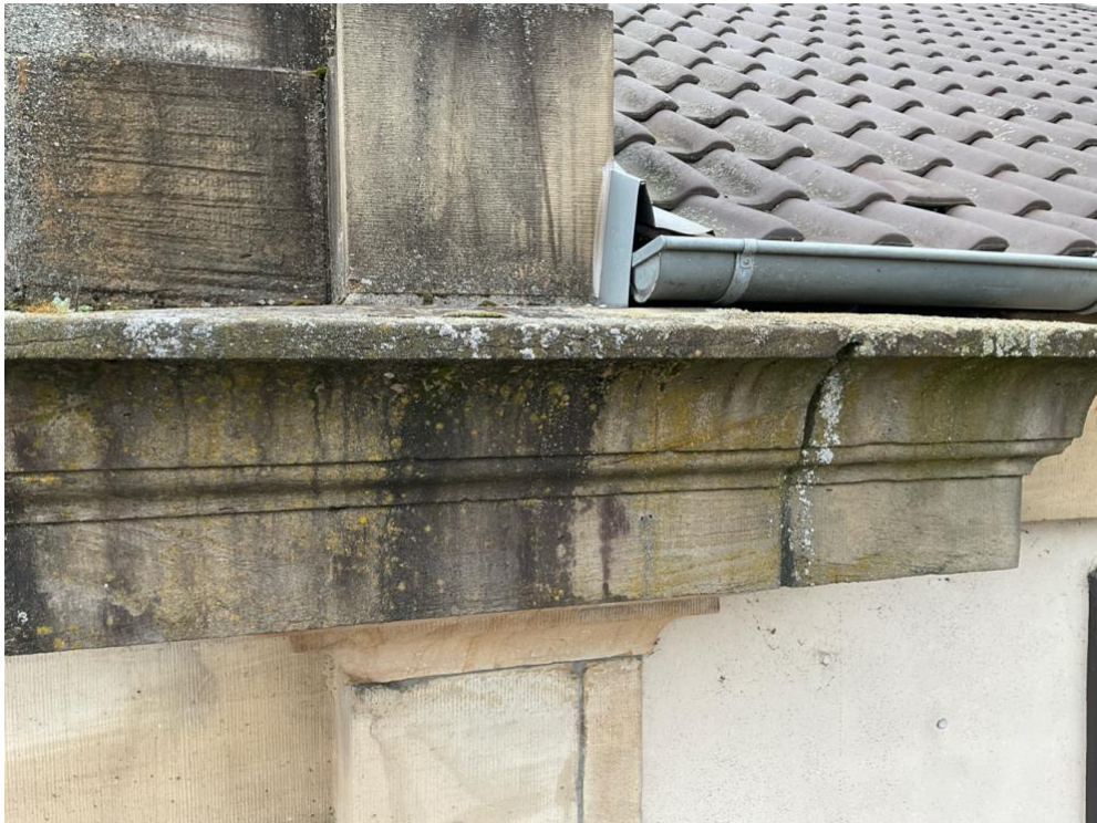
Verschmutzung am Ostgiebel