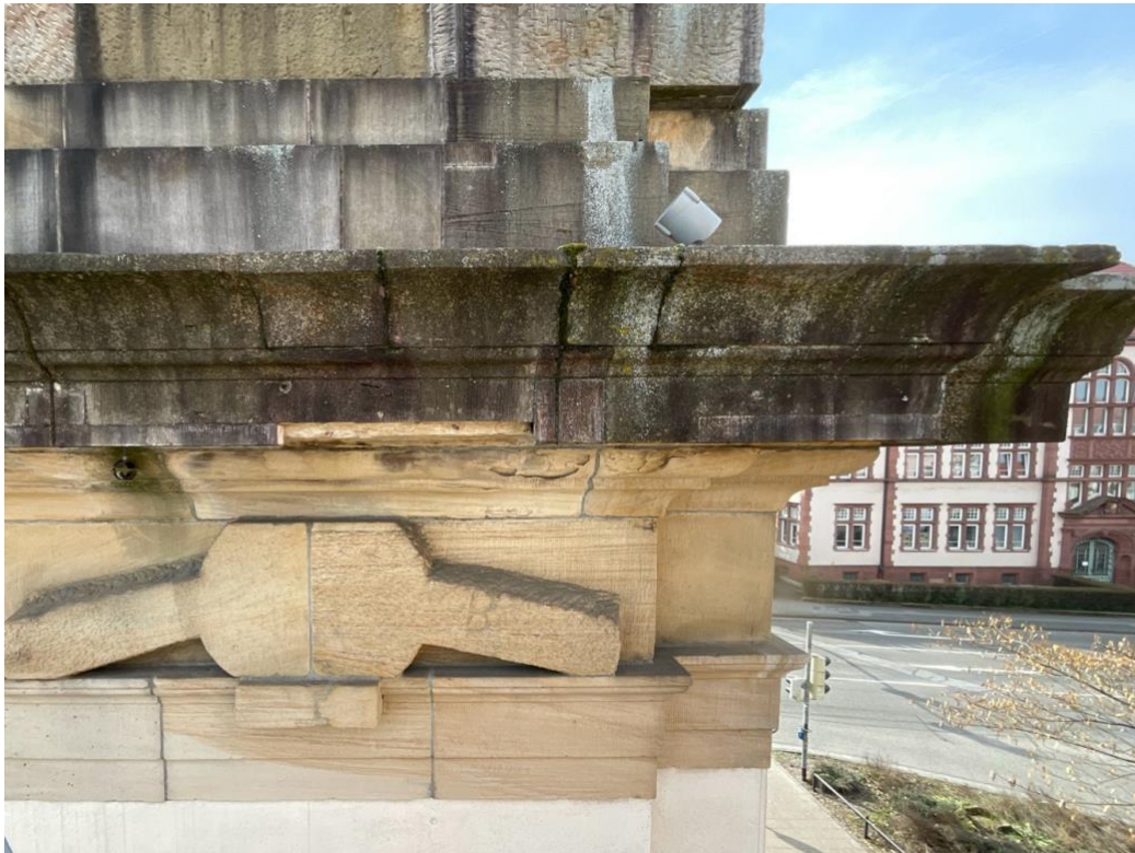
Beispiel einer abgängigen Vierung ( wurde im Zuge einer Hubsteigerbefahrung abgenommen )