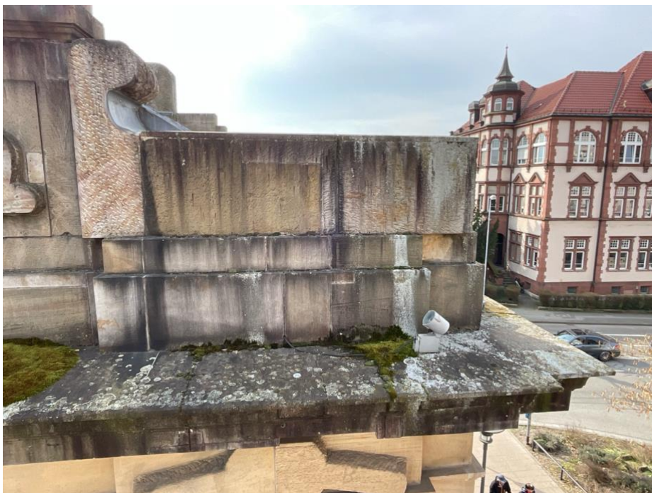
Verschmutzung Nordgiebel rechte Ecke