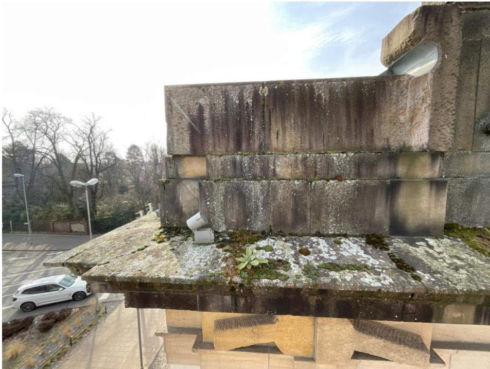
Verschmutzung Nordgiebel linke Ecke